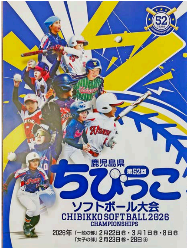
↑第52回大会のプログラム（表紙）

今回も開催に先立って主催の南日本新聞社が大会の組み合わせ・出場チームの紹介を行い、開幕を大々的にPR！大会期間中も新聞の紙面を通じて熱戦の様様（選手たちの頑張り）を報道した。