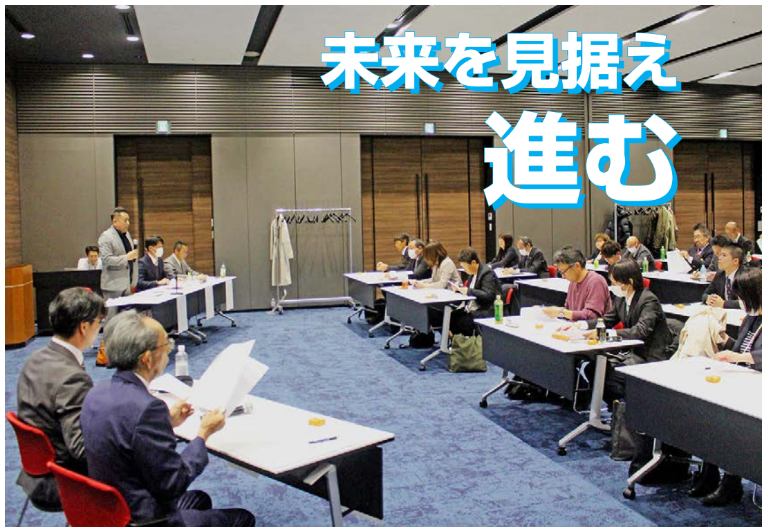
普及本部会 アンダーカテゴリー普及部会連絡会議 (2026.2.23/東京・Japan Sport Olympic Square)

T E L . 03-3811-6911 F A X . 03-3811-6290